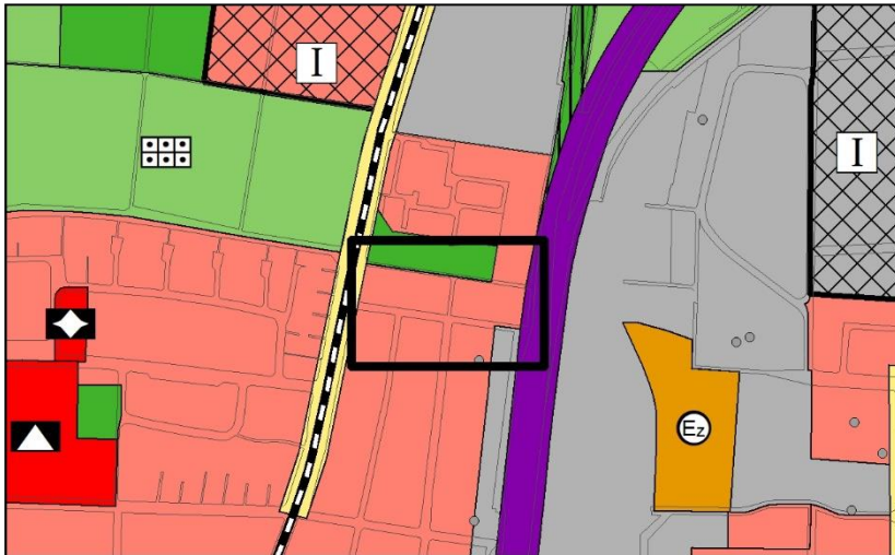
Ursprüngliche Darstellung des FNP