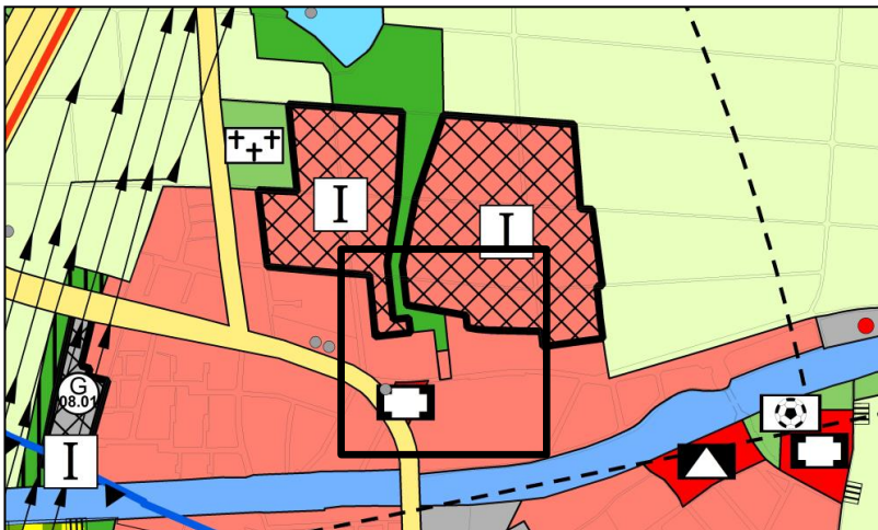
Darstellung des FNP nach Berichtigung